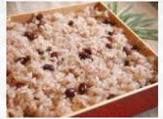
赤飯 3人前 1,000円～

*写真はイメージです。テイクアウト用の容器に入れてお渡しいたします。 *価格は全て税別です。