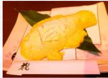
小鯛塩釜焼き 2,500円 鯛塩釜焼き 7,500円