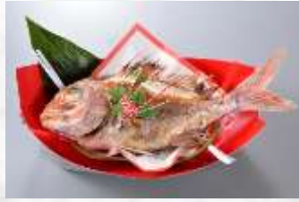
小鯛塩焼付 お食い初め膳 3,500円