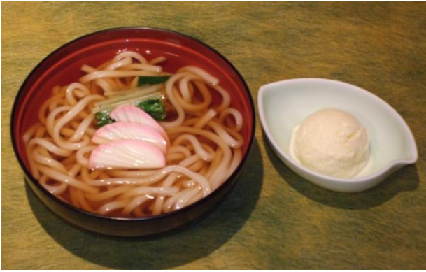
あったか！お子様うどん 500円 (2～6歳児向け)