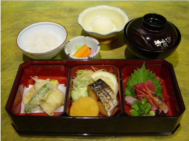
ちょっぴり大人の！和風セット 1,000円 (4～12歳児向け)

お造り・焼物・ミニ天ぷら盛り・ サラダ・ミニハンバーグ・ごはん ・お漬物・お味噌汁・アイス